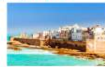
เมืองเอสซาอูอิรา

** พักที่ Adam Park Hotel 5* หรือเทียบเท่า **