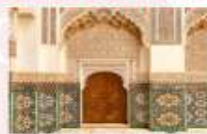
Ben Youssef Medersa