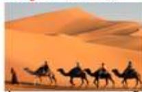
ชีอูฐชมพระอาทิตย์ขึ้น

** พักที่ Karam Palace Hotel 4* หรือเทียบเท่า **