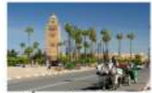
นั่งรถม้าชมเมือง

** พักที่ Adam Park Hotel 5* หรือเทียบเท่า **