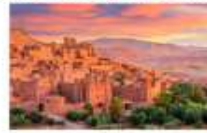
Ait Ben Haddou