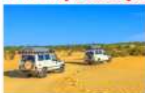
ทะเลทรายซาฮารา

** พักที่ Zahra luxury Desert Camp 4* หรือเทียบเท่า **