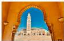
สุเหร่าแห่งกษัตริย์ฮัสซันที่ 2

06.10 น. เดินทางถึงสนามบินอิสตันบูล แวะเปลี่ยนเครื่อง 11.50 น. ออกเดินทางสู่สนามบินคาซาบลังกา เที่ยวบิน TK617 14.50 น. เดินทางถึงสนามบินคาซาบลังกา ประเทศโมร็อกโก