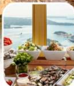
SKYFEAST BUFFET SYDNEY TOWER