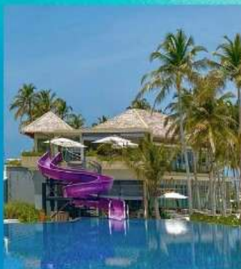
Main Pool with Slider

** ชำระค่าทัวร์ในนาม บริษัท นิดน้อย ทราเวล จำกัดเท่านั้น **