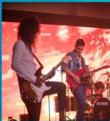
Hard Rock Cafe