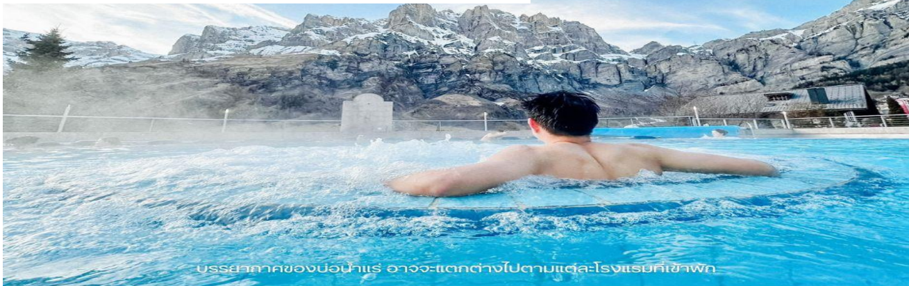
บรรยากาศของบ่อน้ำแร่ อาจจะแตกต่างกันไปตามแต่ละโรงแรมที่เข้าพัก

วันที่ห้า เมืองมาร์ทีนี-โรงละครโรมัน-เมืองออสตา-เมืองตูริน-มหาวิหารตูริน (B/-/D)