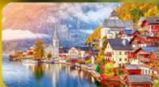
การ์นต์ฟัก Hallstatt / St. Wolfgang หรือริมทะเลสาบ 1 คืน