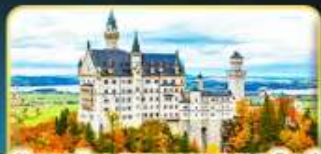
เข้าชมปราสาทนอยชวานสไตน์

คิดสรรความเป็น "ที่สุด" ของยุโรปตะวันออกครบถ้วน