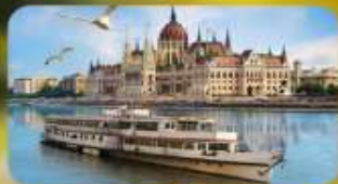
ส่องเรือแม่น้ำดานูบ พร้อมจิบแชมเปญ