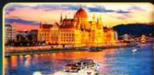
ส่องเรือแม่น้ำดานูบ ช่วง Twilight