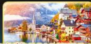
การันตีพัก Hallstatt / St. Wolfgang หรือริมทะเลสาบ 1 คืน