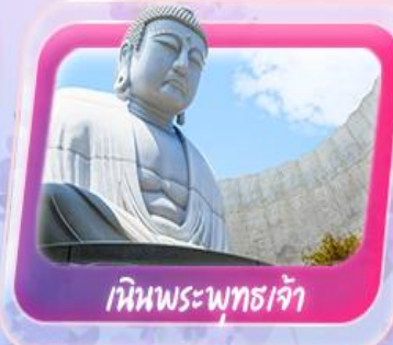
เทินพระพุทธรเจ้า