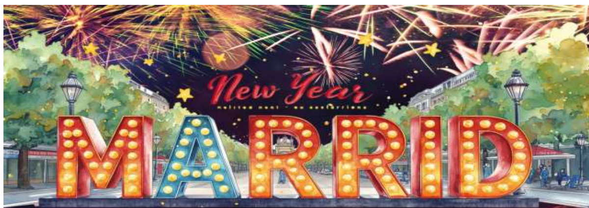
พักที่: NH HOTEL MADRID, INDIGO HOTEL MADRID หรือที่พักระดับใกล้เคียง

*** ร่วมฉลองปีใหม่ 2027 ณ เมืองมาดริด ***