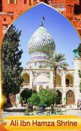
Ali Ibn Hamza Shrine