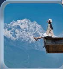
“กาแฟ Yundi'an Coffee”