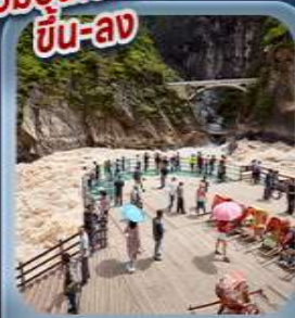
“ช่องแคบเสือกะโรโจน”