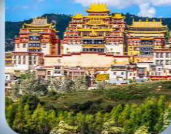
“วัดลามะชงจ้านหลิน”

ขึ้นกระเช้าใหญ่ชมวิวกูภูเขาหิมะมังกรหยก + ชมโชว์ความประทับใจลี่เจียง วัดลามะชงจ้านหลิน • ช่องแคบเสือกะโรโจน • เมืองโบราณแซงกรี่ล่า • ทะเลสาบโป้สุ่ยเหอ ร้านกาแฟเมืองเก่าไปซา Yundi'an Coffee • หมาหยวนมิเตอร์เกจ • วัดหยวนทง