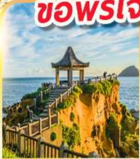
เกาะเหอฝิง

พักย่านซีเหมินติง 2 คืน ขอพรเจ้าแม่กวนอิมพันมือ