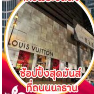
ช้อปปิ้งสุดมันส์ ที่ถนนนาธาน