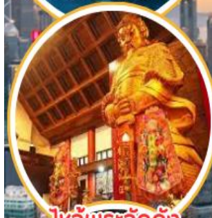
ไหว้พระวัดดั่ง