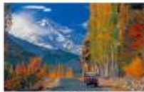
เมืองชิลาส

** พักที่ Shangrila Chilas Hotel หรือเทียบเท่า **