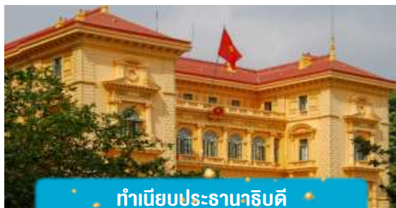
ทำเนียบประธานาธิบดี