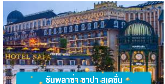
ชนพล่าซา ซาปา สดชื่น