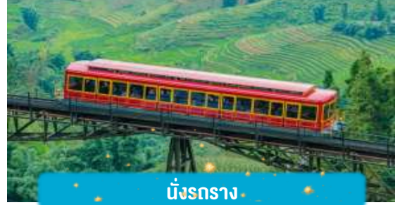
นั้งรกราง

เช้า บริการอาหารเช้า ณ ห้องอาหารของโรงแรม นำท่าน นั้งรกราง ใหม่สุดจากสถานีซาปา สู่สถานี กระเช้าเพื่อขึ้นยอดเขาฟานซีปันระยะทางประมาณ 2 กิโลเมตร ท่านจะได้สัมผัสกับความสวยงามของ ธรรมชาติระหว่างสองข้างทาง อีกทั้งยังได้เห็นวิวของ ทุ่งนาจากรถรางนี้ หมายเหตุ: รวมค่ารถไฟแล้ว นำท่าน นั้งกระเช้าไฟฟ้า เพื่อขึ้นสู่ฟานซีปันยอดเขาสูงสุดแห่งเวียดนามและในภูมิภาคอินโด เป็น กระเช้าไฟฟ้า 3 สายแบบไม่หยุดพัก ขนาดใหญ่จุได้กว่า 30 คน มีความยาวประมาณ 6,200 เมตร หรือ ราว 6 กิโลเมตร