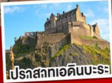
ปราสาทเอ็ดินบะระ