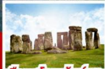
เขื่อนสโตนเฮ็นจ์ และ พิพิธภัณฑน์โรมันบาส