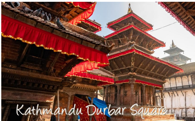
Kathmandu Durbar Square

** ชำระค่าทัวร์ในนาม บริษัท นิดน้อย ทราเวล จำกัดเท่านั้น **