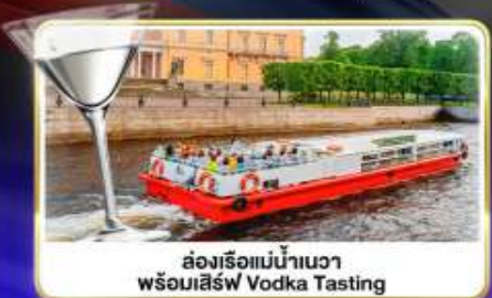
ล่องเรือแม่น้ำวอวา พร้อมเสิร์ฟ Vodka Tasting