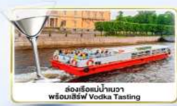
ล่องเรือแม่น้ำเนวา พร้อมเสิร์ฟ Vodka Tasting