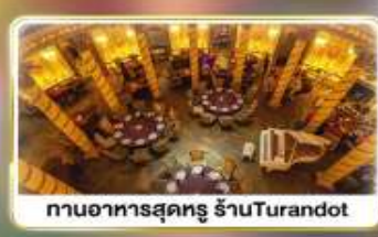
งานอาหารสุดหรู ร้านอาหาร Turandot