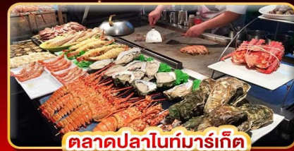
ตลาดปลาไนท์มาร์เก็ต