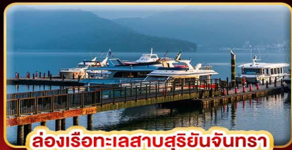
ล่องเรือทะเลสาบสุริยอันจันทร์

ปั่นตุ้ม STREET FOOD แบบจุใจ ขอความรักวัดแดงซาน