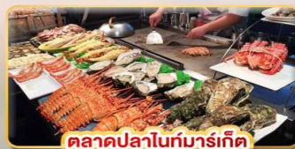
ตลาดปลาไนท์มาร์เก็ต