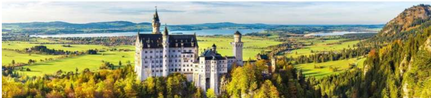
GG12(A) โปรแกรมเยอรมนี เช็ก ออสเตรีย สโลวาเกีย อังการี 9 วัน 6 คืน

บ่าย นำท่านเดินทางขึ้นปราสาทชมความสวยงามของ ปราสาทนอยชวานชไตน์ ( Neuschwanstein Castle ) โดยรถบัสเล็ก (หากช่วงที่หิมะตกหนักรถบัสจะหยุดให้บริการแก่นักท่องเที่ยว เนื่องด้วยเพื่อความปลอดภัยทางบริษัทฯ จะนำคณะเดินขึ้น – ลงปราสาท จากเวลาหิมะตกทางจะขึ้นและอันตราย) นำเข้าชมต้นแบบของปราสาทเจ้าหญิงนิทราในดินสีย์แลนด์ ซึ่งปราสาทนอยชวานชไตน์ตั้งตระหง่านอยู่บนยอดเขาสูงปราสาทในเทพนิยาย ซึ่งเป็นปราสาทของพระเจ้าลูควิกที่ 2 หรือ เจ้าชายหงส์ขาว พระเจ้าลูควิกทรงเป็นบุคคลที่มีลักษณะนิสัยที่แปลกเป็นปริศนา (eccentric)และเป็นผู้ที่สิ้นพระชนม์ในสถานการณ์ที่ค่อนข้างมีเงื่อนไข สุขภาพจิตของพระองค์ในบั้นปลายอาจจะไม่ปกติแต่ก็ไม่มีหลักฐานทางการแพทย์ที่ เป็นที่ยืนยันได้แน่นอนแต่สิ่งที่ทรงกังวลไว้เป็นมรดกแก่ชนรุ่นหลังคืองานทางสถาปัตยกรรมที่ทรงก่อสร้างรวมทั้งวัง และปราสาทใหญ่โตที่ถึงหรูหราโอ้อวด เต็มไปด้วยจินตนาการราวเทพนิยายหลายแห่ง รวมทั้งปราสาทนอยชวานชไตน์ ซึ่งเป็นปราสาทที่มีชื่อเสียงเป็นที่รู้จักกันทั่วโลก และทรงเป็นผู้อุปถัมภ์ริชาร์ด วากเนอร์ คีตกวี และนักเขียนดนตรีโอเปร่าคนสำคัญของเยอรมนี ชมความวิจิตรพิสดารของห้องต่างๆ ที่ได้รับการตกแต่งอย่างงดงาม โดยการ ออกแบบของคริสเตียน แองค์ จากนั้นนำคณะเดินลงจากปราสาท