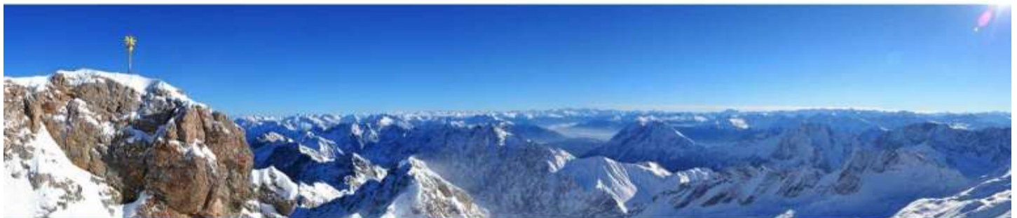
GG12(A) โปรแกรมเยอรมนี เช็ก ออสเตรีย สโลวาเกีย ฮังการี 9 วัน 6 คืน

เที่ยง รับประทานอาหารกลางวัน ณ ภัตตาคาร (มื้อที่ 4) บนยอดเขา