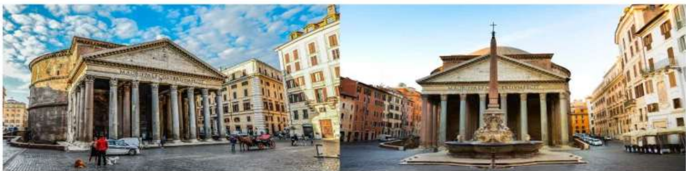
GG02 ไปสแตรมอิตาลี สวิตเซอร์แลนด์ ฝรั่งเศส 9 วัน 6 คืน

นำท่านชม วิหารแพนเธออน เป็นสถาปัตยกรรมสำคัญ สร้างขึ้นโดยจักรพรรดิมาร์คัส วิบซีอุส อะกริบปา จุดมุ่งหมายในการสร้างไม่ชัดเจนต่อมาได้มีการสร้างใหม่ในสมัยจักรพรรดิฮาเดเรียน ใน ค.ศ. 126 และซ่อมใหญ่ในปี ค.ศ. 202 โดยจักรพรรดิ เซพติมิอุส เซเวรุส และคาราคาลา การก่อสร้างในสมัยจักรพรรดิฮาเดเรียน วัตถุประสงค์เพื่อใช้เป็นเทวสถานของเทพเจ้าโรมัน 7 องค์หรือเทพแห่งดาวในระบบสุริยะ: APOLLO พระอาทิตย์ DIANA พระจันทร์ MARS อังคาร MERCURY พุธ JUPITER พฤหัส VENUS ศุกร์ SATURN เสาร์ ลักษณะเด่นของตัววิหารคือมีหลังคาทรงกลมและโค้งเป็นครึ่งวงกลม วางอยู่บนเสาหินแกรนิตขนาดมหึมา วิหารมีความสูงถึง 43.3 เมตร รายละเอียดของโดมหลังคาภายในวิหาร รวมถึงโครงสร้างที่แข็งแรงและยืนหยัดมานานกว่าสองพันปี ตั้งแต่คริสต์ศตวรรษที่ 7 เป็นต้นมา วิหารแห่งนี้ถูกใช้เป็นโบสถ์โรมันคาทอลิก อุทิศแด่พระแม่มาเรียและฟูลซีซฟเพื่อศาสนาออกเดินทางสู่ แคว้นกอสคาฆ่า เมืองปิซ่า ท่านจะได้ชมทิวทัศน์อันสวยงามของบ้านเรือนแบบอิตาลีและปราสาทตั้งสูงสง่างามอยู่บนเนินเขา และเป็นแหล่งผลิตไวน์ชั้นดีของเมืองนี้