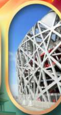
ผ่านชมสนามกีฬาฟาริงก