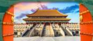
พระราชวังกู้กง Forbidden City Beijing