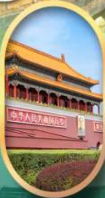
จัสมตรีสเทียนอันเหมิน