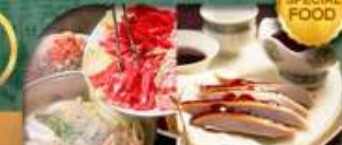
เมนู สุกี้มองโก + เปิดปักกิ่ง เดินทาง เม.ษ. - ต.ค. 69