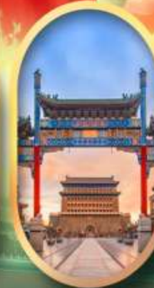
ถนนคนเดินเวียนเหมิน