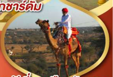
ฟรี ขี่อูฐ เมืองมันทวา ราคาเริ่มต้น