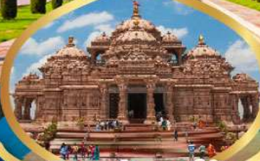
วิหารอักซาร์ดีม