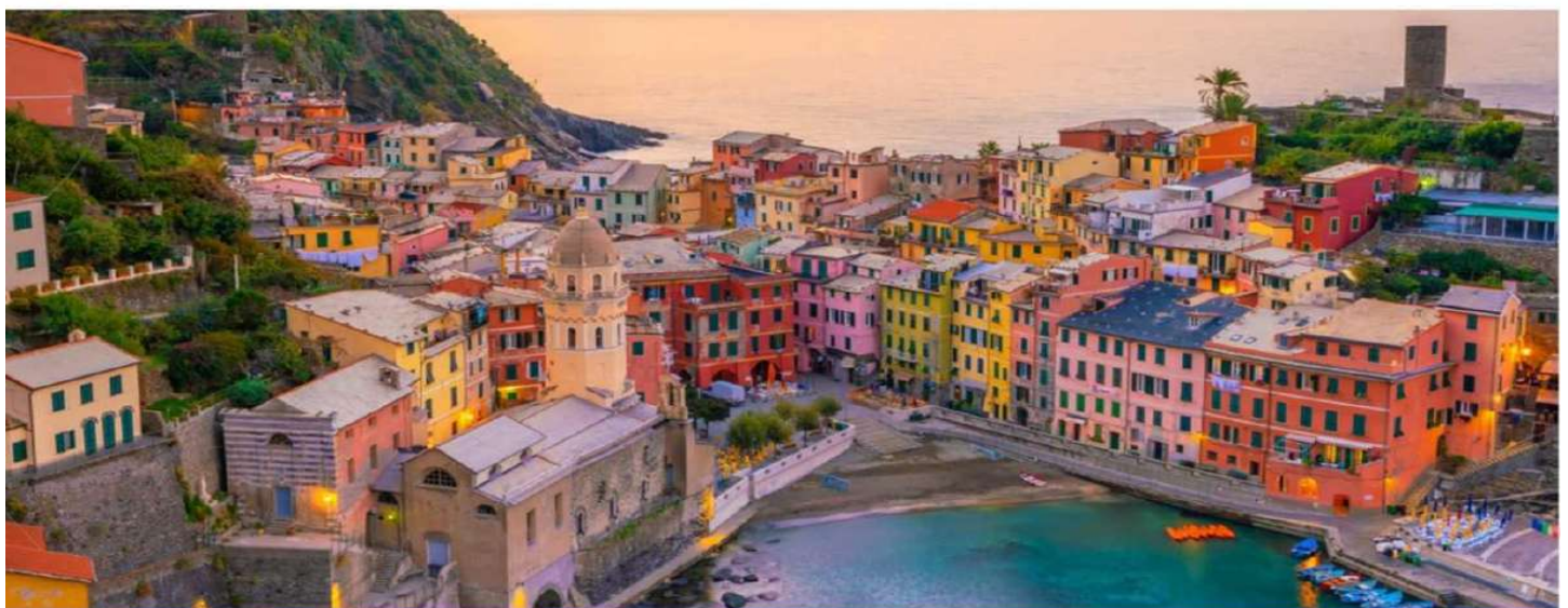
GG34 โปรแกรมอิตาลี โตโลไมต์ ซิงคิว เตรี 9 วัน 6 คืน

บ่าย จากนั้นนำท่านออกเดินทางสู่ หมู่บ้านริโอแมกจันยอเร หมู่บ้านสวยอีกหมู่บ้านหนึ่งของ ซิงเคอร์ เตรี ตั้งอยู่ในโตรกของหน้าผาอาคารบ้านเรือนต่างๆ ที่มีสีสันหลากหลายเจดสีสวยงาม และขึ้นชื่อในเรื่องไวน์ จากนั้นนำท่านเดินทางกลับสู่ เมืองลาสปีเซีย เพื่อชมความสวยงามของเมือง นำท่านเดินเล่นริมทะเลเมดิเตอร์เรเนียนที่เต็มไปด้วยเรือประมง เรือขนส่ง และเรือส่วนตัวที่เรียงรายซึ่งเป็นภาพที่สวยงามยิ่งนัก จนได้เวลานัดหมาย