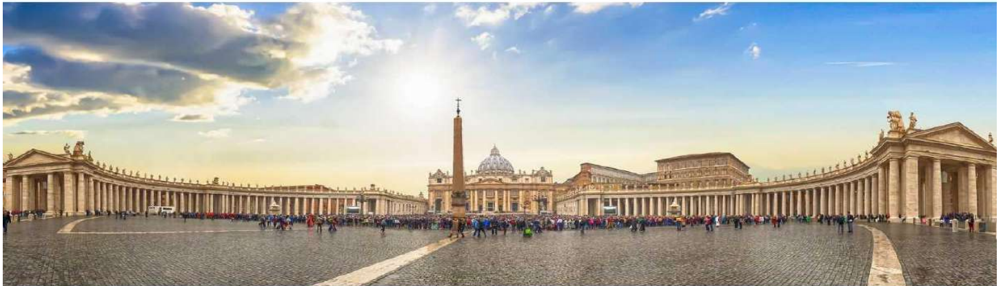
GG34 โปรแกรมอิตาลี ไทไลมาต์ ซิงกิว ๑๖ วัน ๖ คืน

หลังอาหารเช้าท่านชม นครวาติกัน รัฐอิสระที่ปกครองตนเองเป็นศูนย์กลางของศาสนาคริสต์นิกายโรมันคาทอลิก นำท่านเข้าชมภายใน มหาวิหารเซนต์ปีเตอร์ (เข้าชมฟรี) สถาปัตยกรรมล้ำค่าที่สุดแห่งหนึ่งของโลก ซึ่งตกแต่งอย่างโอ่อ่าหรูหรา ชมรูปปั้นแกะสลัก “เพียต้า” ผลงานของศิลปินเอก ไมเคิลแองเจโล เสาพลับพลาที่ออกแบบโดย เบร์นินี และยอดโดมขนาดใหญ่ ซึ่งปัจจุบันเป็นสิ่งล้ำค่าคู่บ้านคู่เมืองของอิตาลี ชมร่องรอยของศูนย์กลางแห่งจักรวรรดิโรมันอันศักดิ์สิทธิ์ โรมันฟอรัม จากนั้นนำท่านเดินทางสู่ จัตุรัส นาโวนา จัตุรัสที่เป็นสถาปัตยกรรมแบบบาโรก เรียกได้ว่าเป็นความยอดเยี่ยมที่สุดของกรุงโรม ประเทศอิตาลี ในอดีตเป็นสนามกีฬาโรมันที่ใช้ต่อสู้ประลองอาวุธกันของผู้เข้าแข่งขันที่จำลองมาจากการต่อสู้ทางทะเล จัตุรัส นาโวนา เป็นจัตุรัสที่ได้ชื่อว่าเป็นจัตุรัสที่มีชื่อเสียงที่สุด และสวยงามที่สุดแห่งหนึ่งในกรุงโรมที่เปี่ยมไปด้วยความมีชีวิตชีวา เต็มไปด้วยนักท่องเที่ยวจากทั่วสารทิศ