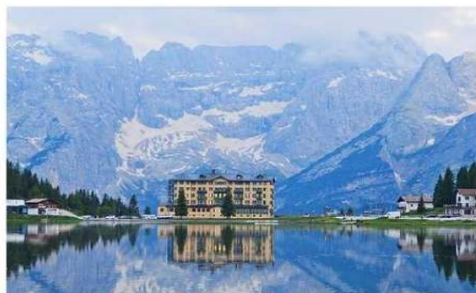
GG34 โปรแกรมอิตาลี โดโลไมต์ ซิงกิว เตรี 9 วัน 6 คืน

เดินทางสู่ ทะเลสาบมิซูรีนา (Misurina Lake) ทะเลสาบขนาดใหญ่ตอนเหนือของเมืองคอร์ตินา(Cortina) เป็นหนึ่งในสถานที่ท่องเที่ยวที่งดงามแห่งหนึ่งใ เทือกเขาโดโลไมท์ ในวันที่ลมสงบน้ำในทะเลสาบมิซูรีนา จะนิ่งเป็นเหมือนกระจกบานใหญ่เป็นเงา สะท้อนแลนด์มาร์คโดดเด่นคือ ตึกเหลือง ซึ่งเป็นศูนย์ฟื้นฟูผู้ป่วยระบบทางเดินหายใจ ซึ่งมีเบื้องหลังเป็น เทือกเขาที่ปกคลุมด้วยหิมะ ล้อมรอบด้วยทิวสนสีเขียวขจีในช่วงฤดูร้อน สะท้อนทิวทัศน์โดยรอบได้อย่างชัดเจน อีสระให้ท่านชม ทะเลสาบมิซูรีนา และบันทึกภาพอันสวยงามน่าประทับใจ