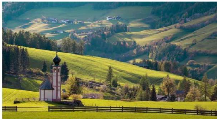
GG34 โปรแกรมอิตาลี โดโลไมท์ ซิงกิว 9 วัน 6 คืน

** ชำระค่าทัวร์ในนาม บริษัท นิดน้อย ทราเวล จำกัดเท่านั้น **