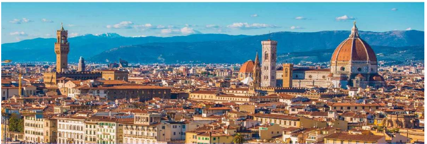
GG34 โปรแกรมอิตาลี โตโลโมเต ซิงกิว เทร 9 วัน 6 คืน

พักค้างคืน ณ Best Western Plus CHC Florence หรือระดับเดียวกัน (4 ดาว) (คืนที่ 4)