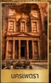
นครเพตรา