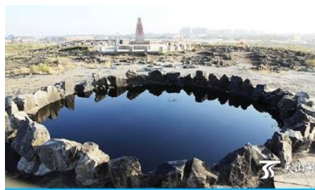
บ่อน้ำมันสีดำ

เที่ยง ระหว่างทางแวะรับประทานอาหารกลางวัน ณ ภัตตาคาร (11)