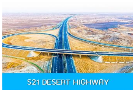
S21 DESERT HIGHWAY