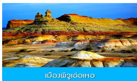
เมืองลู่อ่อเหอ

พักที่ XI BU WU ZHEN HOTEL ระดับ 4 ดาวท้องถิ่นหรือเทียบเท่าในเมืองลู่อ่อเหอ