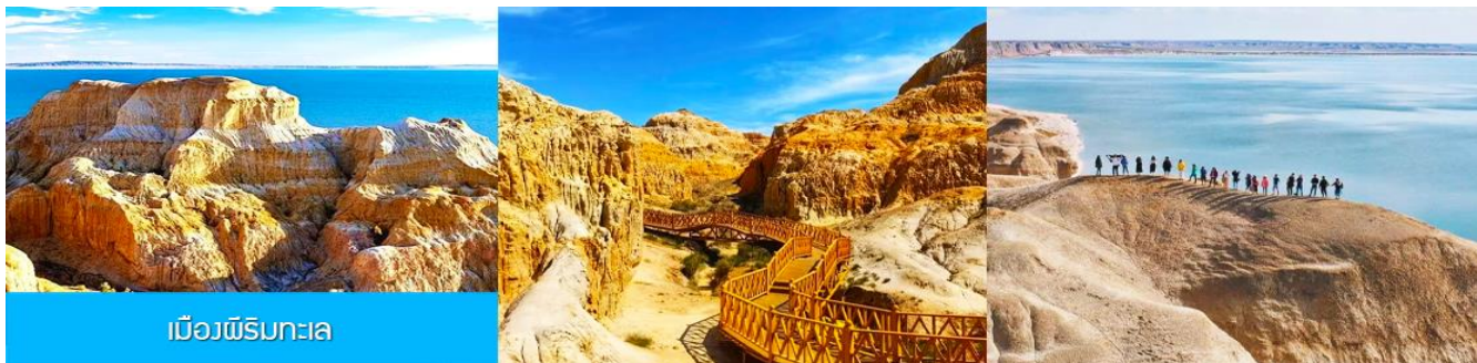
เมืองผีริมทะเล

นำท่านเที่ยวชม เมืองผีริมทะเล 海上魔鬼城 (คล้ายแพะเมืองผีที่อยู่ติดทะเล) เป็นอุทยานท่องเที่ยวกลางทะเลทรายกว้างใหญ่ที่ห่างไกลผู้คน มีลักษณะภูมิประเทศทางธรณีวิทยาน่าพิศวง นำท่านเดินตามระเบียงชมวิวเพลินเพลิดเพลินกับทัศนียภาพที่น่าพิศวงของภูเขาหินแบบต้นเสียดที่คล้ายกับภูเขาสายรุ้งในมณฑลกานซู่ งามน่าขำด้วยทะเลสาบขนาดใหญ่ ที่มองไกลสุดตาคล้ายท้องทะเล จนเป็นที่มาของชื่ออุทยาน ว่าเป็นเมืองผีกลางทะเล (ทะเลสาบ)