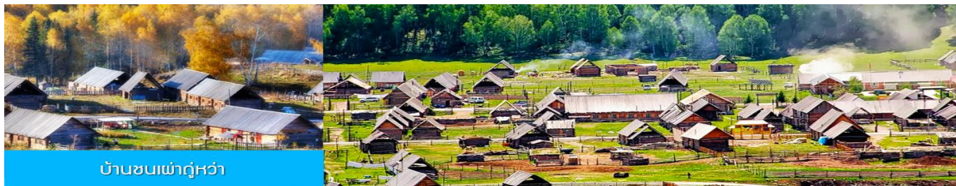
บ้านชนเผ่ากูหว่า

นำท่านเที่ยวชม หมู่บ้านเหม่มู่ซุน 禾木村 หมู่บ้านโบราณที่ขึ้นชื่อด้วยทัศนียภาพที่สวยงามท่ามกลางความสงบ เป็นชุมชนของชนเผ่ากูหว่าที่เป็นชนพื้นเมืองในเขตมองโกเลีย ที่เป็นชนกลุ่มน้อยที่เก่าแก่ที่สุดในจีนพำนักอาศัยอยู่ หมู่บ้านแห่งนี้ ตั้งอยู่ในเขตอุทยานคานาสีอ ทางฝั่งตะวันตกเฉียงใต้ของเทือกเขาอัลไต หมู่บ้านนี้ได้รับการขนานนามว่าเป็นหมู่บ้านชนเผ่าที่มีเอกลักษณ์โดดเด่น ถูกจัดลำดับเป็นหนึ่งในหกหมู่บ้านโบราณที่ดีที่สุด และหนึ่งในแปดสถานที่ถ่ายทำภาพยนตร์ยอดเยี่ยมของจีน มีแม่น้ำเหม่มู่ไหลผ่านหมู่บ้าน ด้วยทัศนียภาพที่สวยงาม ท่ามกลางความสงบแห่งธรรมชาติ หมู่บ้านแห่งนี้มีช่างภาพ นักวาดเขียนและนักท่องเที่ยวต่างมาเยือนอย่างไม่