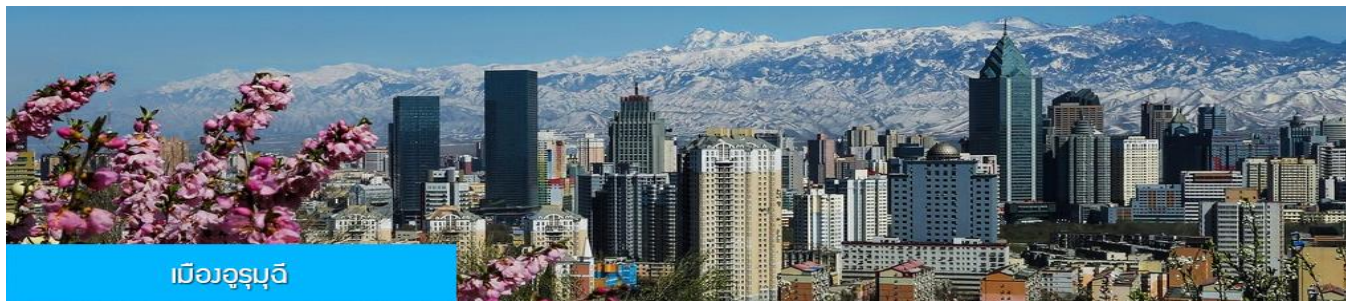
เมืองอูรูมูฉี