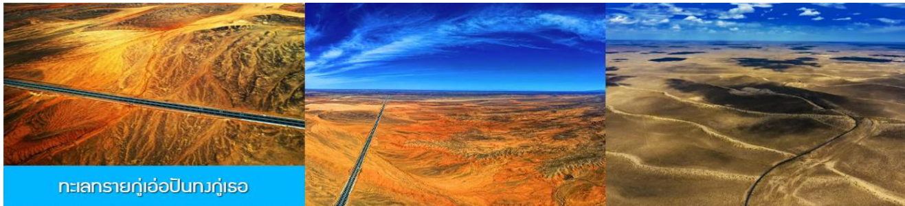
ทะเลทรายกู๋เอ๋อปีนทงกู๋เอ๋อ