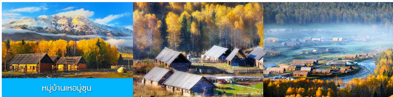
หมู่บ้านเหม่มู่ซุน

พักที่ SU TONG HOLIDAY HOTEL โรงแรมระดับ 4 ดาวท้องถิ่น หรือเทียบเท่าในเมืองปูเอ๋อจิน