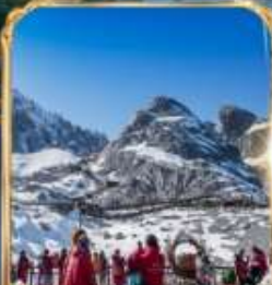
ภูเขาหิมะมังกรหยก +กระเช้าใหญ่