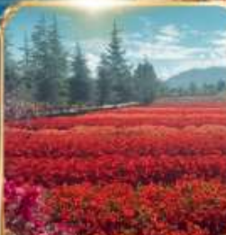
สวนดอกไม้ HUA YU MU CHANG