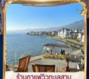
ร้านค้าแพรววิวกะเลสาบ BAN SHAN YUE (รวมค่าเช่า ไม้รวมเครื่องดื่ม และค่าเช่าเสื้อถ่ายรูป)