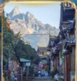
เมืองโบราณซูเออ