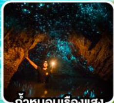
ถ้ำหอนเรือแสง ไวท์ไต้