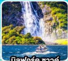
บิลฟอร์ด ชาวดี นี่เรื่องชมความงาม พยอร์ด