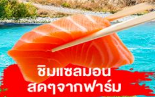
ชิมเซลมอน สดๆจากฟาร์ม