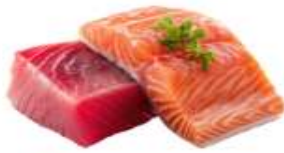
● ไส้ทานปลาดิบ