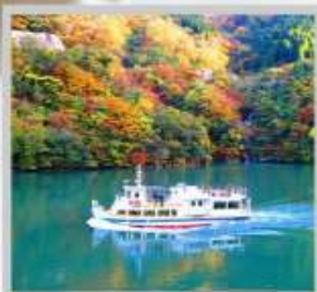
“SHOGAWA YURAN CRUISE”