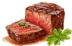
● ไส้ทานเนื้อวัว

ขอความกรุณาแจ้งวัตถุดิบที่ท่านแพ้หรือไม่สามารถรับประทานได้