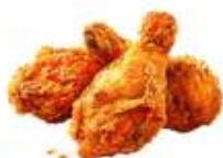
● ไส้ทานสัตว์ปีก (ไก่)