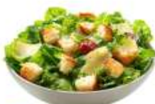
● สลัดหรือผัก