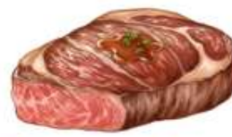
● ไส้ทานเนื้อหมู