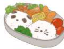
● อาหารสำหรับเด็ก ( 2-11 ปี ) *วัตถุดิบขึ้นอยู่กับทาว์ราน