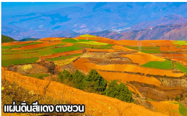
แผ่นดินสีแดง ตงชว่น

นำทุกท่านเดินทางสู่ เมืองตงชว่น (DONGCHUAN) หรือที่รู้จักกันในชื่อ หงถู่ตี้ ซึ่งแปลว่า แผ่นดินสีแดง เมืองตงชว่นตั้งอยู่ทางทิศตะวันออกเฉียงเหนือของมณฑลยูนหนาน มีภูมิประเทศเป็นทิวเขาสลับซับซ้อน ชาวพื้นเมืองส่วนใหญ่ประกอบอาชีพปลูกข้าวสาลี มันสำปะหลัง ฝักต่างๆและดอกไม้บานาพันธ์ุ และตงชว่น ยังถือว่าเป็นจุดท่องเที่ยวไฮไลท์อีกหนึ่งแห่งของคุณหมิง เป็นจุดที่นักท่องเที่ยวนิยมแวะมาเก็บภาพบรรยากาศที่สวยงาม นำท่าน