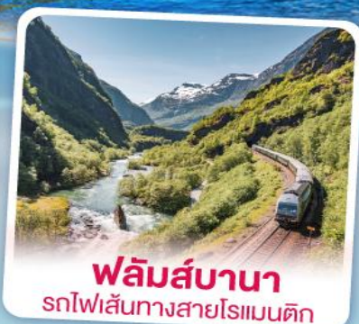
ฟลิคส์บานา รถไฟเส้นทางสายโรแมนติก