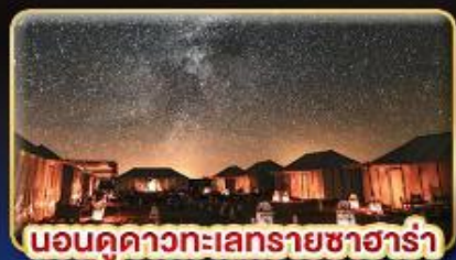
นอนดูดาวทะเลทรายซาฮารา