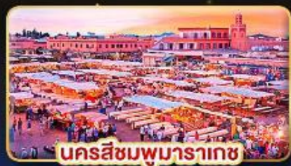
นครสีชมพูมาราเกช