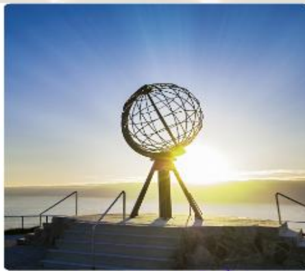
สับพีสดิบแดนโวกิ้ง ชมพระอาทิตย์เที่ยงคืน