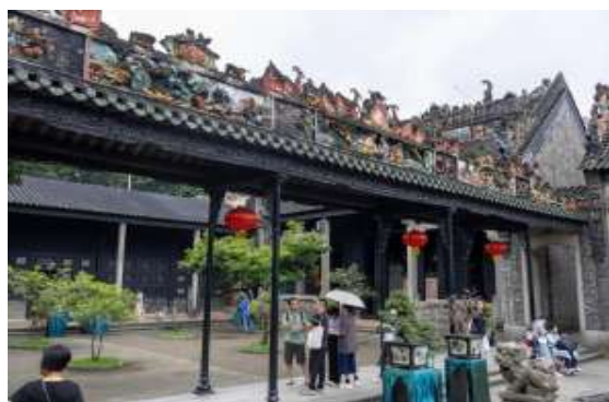
ปัจจุบันเปิดเป็นพิพิธภัณฑ์ศิลปะและ

เป็นอาคารสไตล์จีนโบราณที่สร้างขึ้นในสมัยราชวงศ์ชิง (ปี ค.ศ. 1894) โดยกลุ่มตระกูลเฉิน 72 ตระกูลจากทั่วกวางตุ้งเพื่อใช้เป็นที่พักและเตรียมตัวสอบจอหงวน ภายในอาคารมีงานแกะสลักไม้หิน และเครื่องเคลือบดินเผาที่วิจิตรบรรจง เป็นตัวอย่างของสถาปัตยกรรมแบบดั้งเดิมของชาวกวางตุ้งที่สวยงามและได้รับการอนุรักษ์ไว้อย่างดี