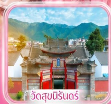
วัดสุขนรินด์ร์