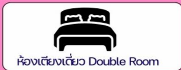
ห้องเตียงเดี่ยว Double Room