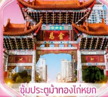
ชุมประตุม้าทองไถ่หยก