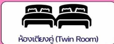
ห้องเตียงคู่ (Twin Room)