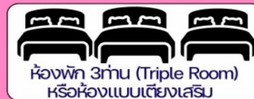
ห้องพัก 3 ท่าน (Triple Room) หรือห้องแบบเตียงเสริม

กรณีพัก 3 ท่านถ้าวันที่เข้าพักโรงแรม ไม่มีห้อง TRP (3 ท่าน) อาจจำเป็นต้องแยกพัก 2 ห้อง (มีค่าใช้จ่ายพักเดี่ยวเพิ่ม) กรณีห้อง TWIN BED (เตียงเดี่ยว 2 เตียง) ซึ่งโรงแรมไม่มีหรือเต็ม ทางบริษัทขอปรับเป็นห้อง DOUBLE BED แทนโดยมีต้องแจ้งให้ทราบล่วงหน้า หรือหากต้องการห้องพักแบบ DOUBLE BED ( 1 เตียงใหญ่) ซึ่งโรงแรมไม่มีหรือเต็ม ทางบริษัทขอปรับเป็นห้อง TWIN BED แทนโดยมีต้องแจ้งให้ทราบล่วงหน้ากรณีห้องพักในเมืองที่ระบุไว้ในโปรแกรมมีเทศกาลวันหยุดยาว มีงานประชุมหรืองานแฟร์ต่างๆ บริษัทขอจัดที่พักในเมืองใกล้เคียงแทน