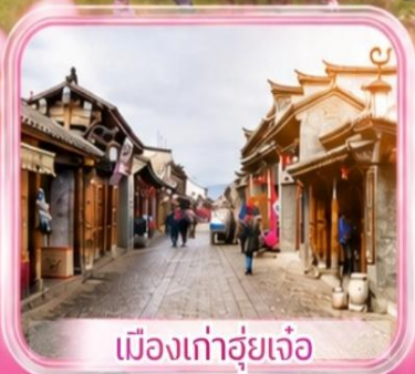
เมืองเก่าอู่ยเจ้อ