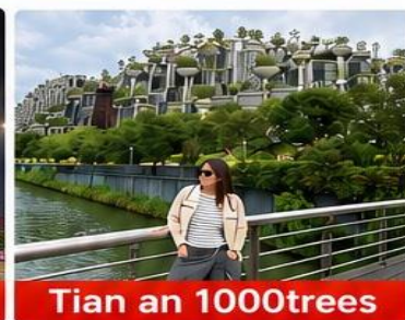
Tian an 1000trees