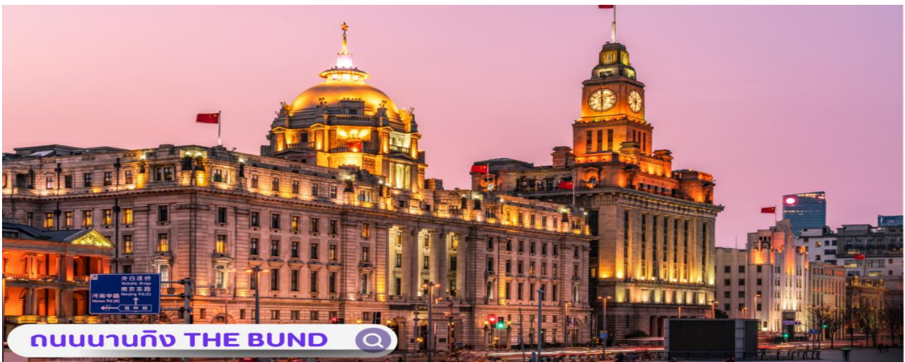
ถนนนานจิง THE BUND

นำท่านสู่บริเวณ หาดไว่ทาน (WAITAN) ซึ่งไม่ได้เป็นหาดทรายชายทะเลแต่อย่างใด แต่เป็นย่านถนนริมแม่น้ำที่มีความยาว 1.5 กิโลเมตร ไปตามริมแม่น้ำหวงผู่ฝั่งตะวันตกซึ่งอยู่ในย่านเมืองเก่า หาดไว่ทานยังเคยเป็นสถานที่ถ่ายทำภาพยนตร์ที่โด่งดังเรื่อง เจ้าพ่อเซียงไฮ้อิสระท่านพลิดพลินที่ ถนนนานจิง(NANJING ROAD) เป็นย่านช้อปปิ้งเก่าแก่ที่สุดของเซียงไฮ้ เป็นตลาดซื้อขายของกันคึกคักตั้งแต่ทศวรรษ 1920 ตั้งอยู่ฝั่งผู้ซีกินพื้นที่ยาวตั้งแต่ฝั่งตะวันตกของ “เดอะ บันด์” ถึง “พีเพิลส์