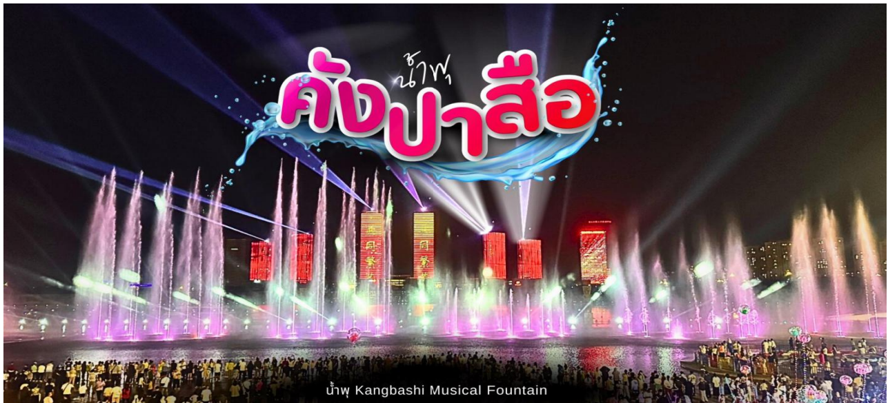
น้ำพุ Kangbashi Musical Fountain

** ชำระค่าทัวร์ในนาม บริษัท นิดน้อย ทราเวล จำกัดเท่านั้น **