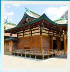
Imamiya Ebisu Shrine