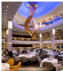
MAIN DINING ROOM