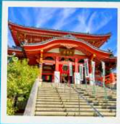
Osu Kannon Temple