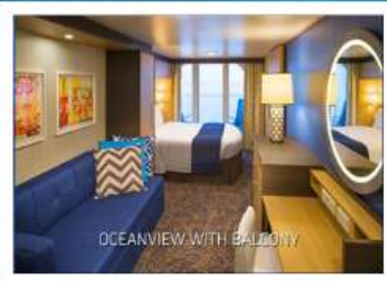
OCEANVIEW WITH BALCONY

** ชำระค่าทัวร์ในนาม บริษัท นิดน้อย ทราเวล จำกัดเท่านั้น **