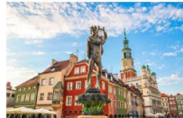
เมืองโปซนัน