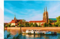
ล่องเรือชมเกาะทัมสกี

** พักที่ HP Plaza Hotel 4* หรือเทียบเท่า **