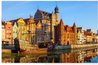
เมืองกตังส์