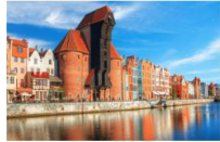
เมืองกตังส์