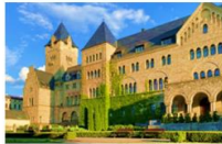
ปราสาทอิมพีเรียล

** พักที่ Vivaldi Hotel 4* หรือเทียบเท่า **