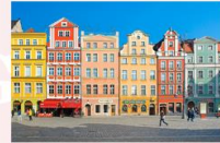
เมืองวรอตซวาฟ