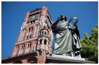
เมืองโตรุน