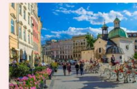
เมืองคราคูฟ

** พักที่ Golden Tulip Krakow Kazimierz Hotel 4* หรือเทียบเท่า **