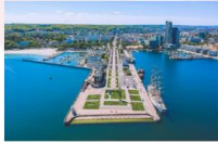
เมืองกดีเนีย