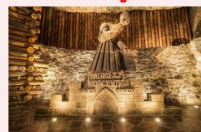
เหมืองเกลือวิลิชก้า