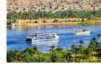
พักผ่อนตามอัธยาศัยบนเรือสำราญ

** พักที่ Royal Beau Rivage Nile cruise 5* หรือเทียบเท่า **