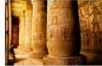
วิหารมาคีนัตฮาบู

** พักที่ Royal Beau Rivage Nile cruise 5* หรือเทียบเท่า **