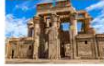
วิหารคอมมอโบ