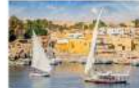
Option ล่องเรือเฟลกะ หรือล่องเรือหมู่บ้าน Nubian Village

** พักที่ Royal Beau Rivage Nile cruise 5* หรือเทียบเท่า **