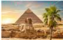
มหาพีระมิดกิซา