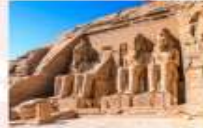
มหาวิหารอาบูซิมเบล