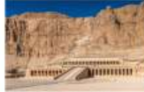
หุบผาซัคเรีย