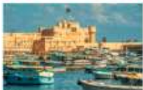
เมืองอเล็กซานเดรีย

DAY3 อเล็กซานเดรีย-ป้อมปราการซีวาค-พระราชวังอัลมอนตาซาร์-ห้องสมุดอเล็กซานเดรีย