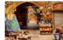
ตลาดชานเอลคาลีส์

20.50 น. ออกเดินทางสู่อิสตันบูล เที่ยวบิน TK695