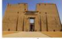
วิหารเอ็ดฟู