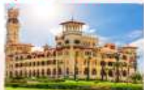
พระราชวังอัลมอนตาซาร์

** พักที่ Movenpick Cairo Hotel 5* หรือเทียบเท่า **