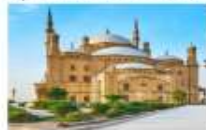
Salah EL Din Citadel & Mohamed Ali Mosque

** พักที่ Movenpick Cairo Hotel 5* หรือเทียบเท่า **