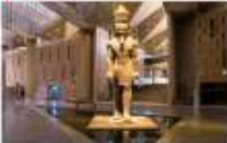
Grand Egyptian Museum

** พักที่ Movenpick Cairo Hotel 5* หรือเทียบเท่า **