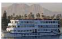
เรือสำราญแม่น้ำไนล์