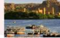
วิหารฟิเล

16.25 น. ออกเดินทางสู่กรุงไคโร สายการบิน Egypt Airlines เที่ยวบิน MS295