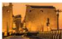
วิหารลักซอร์

** พักที่ Royal Beau Rivage Nile cruise 5* หรือเทียบเท่า **