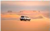
Jeep 4WD สู่ Faiyum