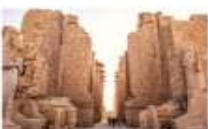
มหาวิหารคาร์นัค

xx.xx น. ออกเดินทางสู่เมืองลักซอร์ โดย Egypt Airlines เที่ยวบิน... xx.xx น. เดินทางถึงสนามบินลักซอร์