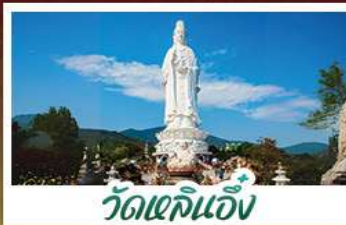
วัดเขลิ้นงู