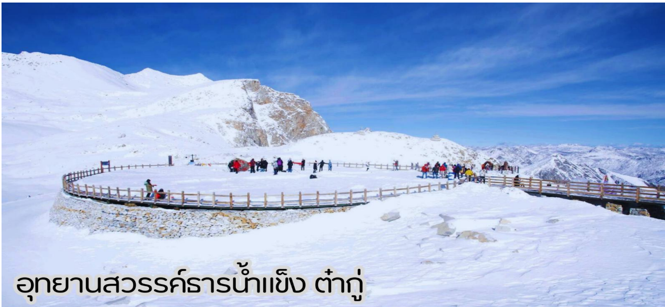
อุทยานสวรรค์ธารน้ำแข็ง ต้ากู่

เช้า : รับประทานอาหารเช้า ณ ห้องอาหารโรงแรม (มื้อที่ 7) นำท่านเดินทางสู่ อุทยานสวรรค์ภูหิมะการ์เซีย “ต้ากู่ปิงชว่น” ถือได้ว่าเป็นอุทยานสมบัติทางธรรมชาติที่ล้ำค่าของมณฑลเสฉวน ที่มีความงามไม่แพ้อุทยานและทะเลสาบใดใดบนโลกมนุษย์ อุทยานสวรรค์ภูหิมะการ์เซีย “ต้ากู่ปิงชว่น” ถูกค้นพบผ่านดาวเทียมเมื่อปี ค.ศ. 1992 โดยนักวิทยาศาสตร์ชาวญี่ปุ่น หลังจากได้ตรวจสอบพื้นที่จึงทราบว่าที่เป็นธารน้ำแข็งที่ตั้งอยู่ต่ำที่สุด ใหญ่ที่สุด และอายุน้อยที่สุดในโลก และยังตั้งอยู่ไม่ไกลจากตัวเมืองทำให้สามารถเดินทางไปท่องเที่ยวได้ง่าย ซึ่งคนในพื้นที่มีความเชื่อว่าภายในธารน้ำแข็งแห่งนี้นั้นมีเทพเจ้าศักดิ์สิทธิ์พิทักษ์อยู่ จึงทำให้ไม่มีใครสามารถพิชิตยอดเขาแห่งนี้ได้จุดที่สูงที่สุดมีความสูงจากระดับน้ำทะเลประมาณ 5,286 เมตรเป็นภูเขาราน้ำแข็งที่ศักดิ์สิทธิ์ ชาวบ้านเชื่อว่าเทพเจ้าพิทักษ์ภูเขานี้ยังอยู่ ทำให้ภูเขานี้ยังมีเคยมีใครพิชิตยอดเขาได้