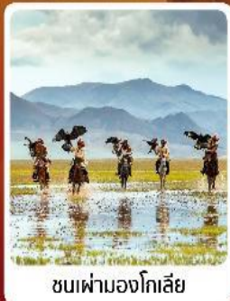
ชมฟ้ามองโกเลีย