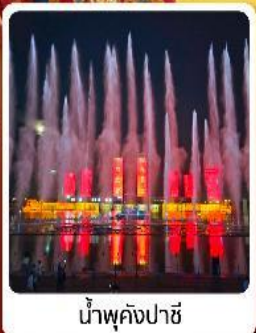
น้ำพุคังปายี

• โอลิมปิก เป็นทราเวลเสียงชาวจีน แหล่งท่องเที่ยวระดับ 5A ของจีน ภูเขาไฟอูลันฮาตา น้ำพุคังปายี น้ำพุที่สูงที่สุดในเอเชีย