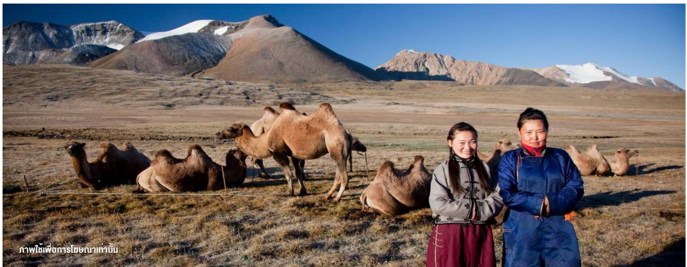
ภาพใช้เพื่อการโฆษณาเท่านั้น

นำท่านร่วมกิจกรรม พิธีต้อนรับเทศกาลโตลมองโก เป็นประเพณีโบราณที่มีมาช้านาน ชาว มองโกลมีอุปนิสัยที่รักเพื่อนฝูงและตรงไปตรงมาไม่เสแสร้ง เมื่อมีเพื่อนหรือแขกมาเยือนก็ มักจะผูกมิตรอย่างจริงใจ และนำท่านร่วมกิจกรรม สวมใส่ชุดมองโก สัมผัสพลังแห่งบรรพ บุรุษ สวมเสื้อคลุมแบบดั้งเดิมที่มีสีสันสดใส ปักลวดลายอันประณีต คุณจะสัมผัสได้ถึงพลัง แห่งบรรพบุรุษที่เคยปกครองดินแดนครึ่งโลก การสวมหมวกขนสัตว์ ผูกสายรัดเอว พร้อม เครื่องประดับเงินแท้ที่ส่องแสงระยิบระยับ จะทำให้ท่านเสมือนกลายเป็นนักรบแห่งทุ่งหญ้า พร้อมเครื่องประดับเงินแท้ที่ส่องแสงระยิบระยับ ของชนเผ่าที่เคยปกครองดินแดนครึ่งโลก เมื่อคุณยืนท่ามกลางทุ่งหญ้าไร้ขอบเขต