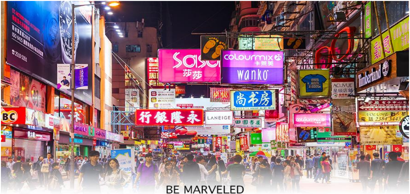
BE MARVELED TSIM SHA TSUI

ที่นี่ และมี SHOPPING COMPLEX ขนาดใหญ่ชื่อ OCEAN TERMINAL ซึ่งประกอบไปด้วยห้างสรรพสินค้าเรียงรายกันอยู่ และมีทางเชื่อม ติดต่อกันสามารถเดินทะลุถึงกันได้ มีสินค้าแบรนด์ดัง ไม่ว่าจะเป็น GIORDANO, BOSSINI, COACH, LONGCHAMP, LOUIS VUITTON, PRADA, HEMES และอีกมากมายให้ท่านได้เลือกซื้อ