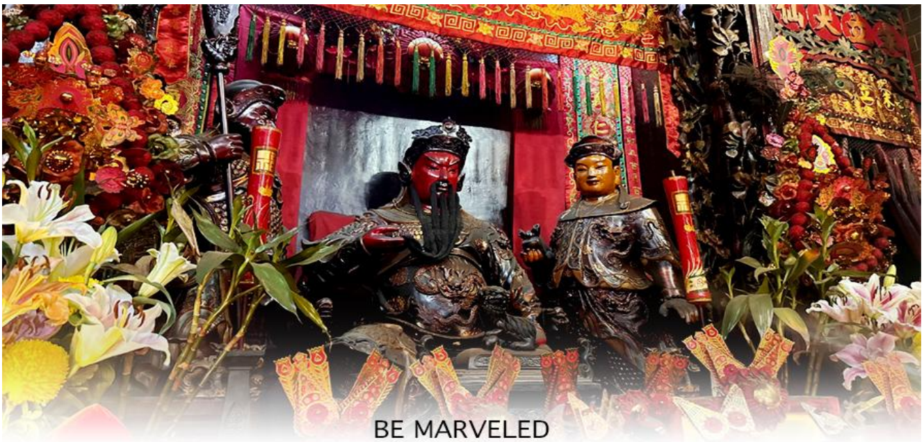
BE MARVELED วัดกวนอู

นำท่านเดินทางสู่ วัดกวนไท หรือที่คนไทยนิยมเรียกว่า "วัดเทพเจ้ากวนอู" เป็นสถาน ศักดิ์สิทธิ์อันเลื่องชื่อ ถือว่าเป็นวัดแห่งเดียวในเขตกาสุก ที่สร้างขึ้นเพื่อบูชา เทพเจ้า กวนอู ซึ่งท่านเป็นเทพเจ้าแห่งความซื่อสัตย์ เปี่ยมไปด้วยคุณธรรม โดยศาลเจ้าพ่อกวน อูแห่งนี้ ผู้ที่มาไหว้สักการะจะนิยมขอพรเรื่องธุรกิจและบรืวาร เนื่องจากว่าเจ้าพ่อกวนอู เป็นเทพเจ้าที่รักษาคำพูดด้วยชีวิต รักคุณธรรม ซื่อสัตย์ ช่วยปกป้องสิ่งเลวร้าย อันตรายต่าง ๆ และช่วยเสริมอำนาจบารมีในการปกครอง ท่านมีจิตใจมั่นคงตั้งขุนเขา มี สติปัญญาเป็นเลิศ และไม่ประมาท ท่านจึงเป็นสัญลักษณ์แห่งความเข้มแข็งโดดเด่นยิ่ง ไม่ ครั้นคร้ามต่อศัตรู ฉะนั้นการมาบูชาขอพรท่าน จะช่วยเสริมดวงไม่ให้พลั้งพล้ำแก่ศัตรู ทำให้มีมิตรที่ซื่อสัตย์ และคุ้มครองบรืวารให้ก้าวหน้าและอยู่เย็นเป็นสุข ซึ่งผู้ประกอบการ อาชีพ ตำรวจ ทหาร และ นักการเมือง จึงมักจะนิยมบูชาเทพเจ้ากวนอู เป็นพิเศษ