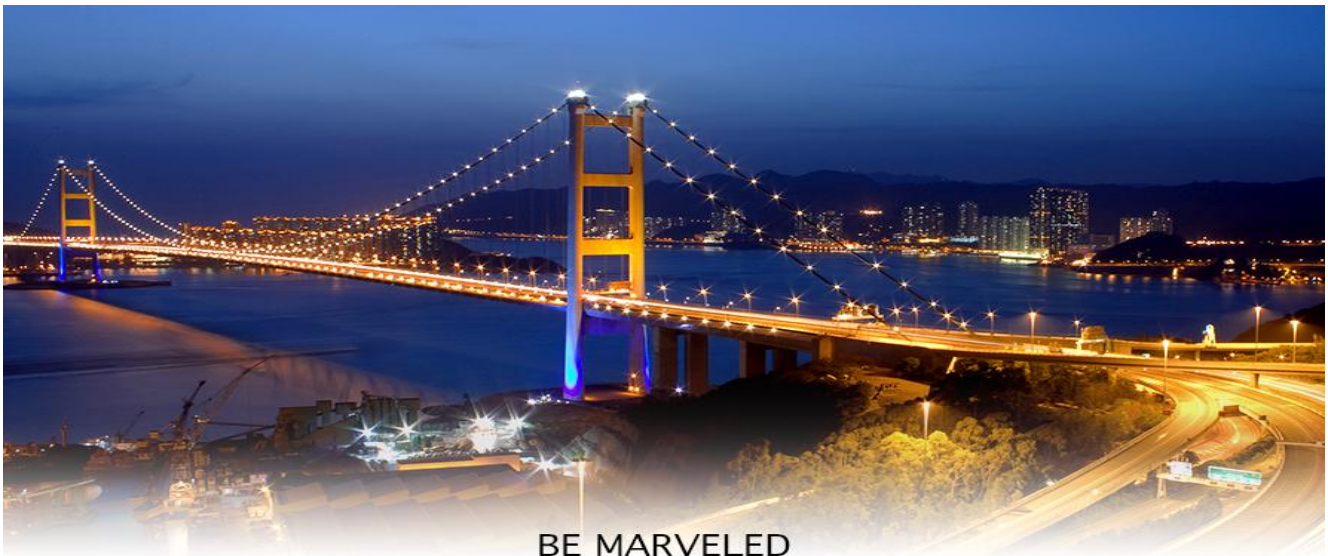
BE MARVELED สะพานแขวนชิงหม่า

นำท่านเดินทาง ผ่านเส้นทางไฮเวย์อันทันสมัยข้ามสะพานแขวนชิงหม่า (TSING MA BRIDGE) ซึ่งเป็นสะพานแขวนสองชั้นที่ยาวที่สุดในโลก โดยมีความยาวทั้งหมด 2.2 กิโลเมตร (1.4 ไมล์) เชื่อมต่อระหว่างฮ่องกงอินเตอร์เนชั่นแนลแอร์พอร์ตกับตัวเมืองฮ่องกง ตัวสะพานชั้นบนจะเป็นทางให้รถยนต์วิ่ง ส่วนชั้นล่างเป็นเส้นทางของเอ็มทีอาร์ (MTR) และแอร์พอร์ตเอ็กสเพรส (AIRPORT EXPRESS TRAINS) สะพานชิงหม่านี้ ได้ถูกคัดเลือกให้เป็นสัญลักษณ์ของคูร์กทั่วโลกอีกด้วย