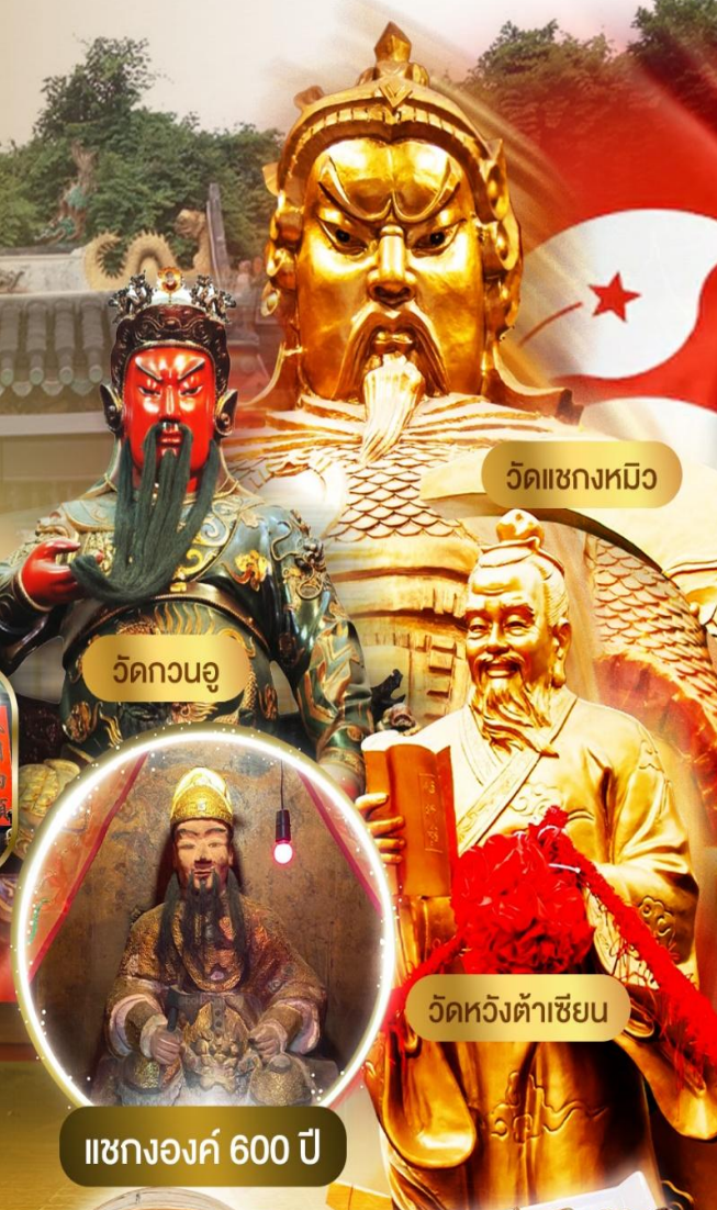
วัดแซกงหมิว