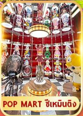
POP MART ซีเหมินติง