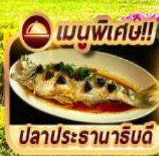
เมนูพิเศษ!! ปลาประจานาริบัติ