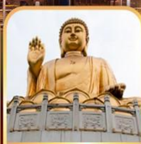
วัดหัวเหยียน