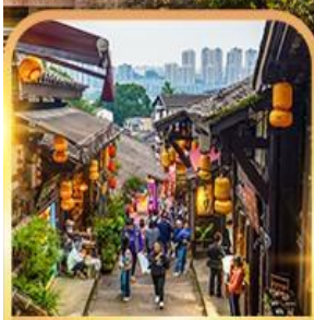
หมู่บ้านโบราณฉือชี่ฮั่ว