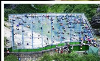
ระเบียงแก้วอุโมงค์