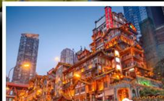
ตลาดแสงเซาตัง