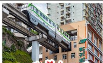
สถานีรถไฟทะเลสาบ

ฉงชิ่ง - อุหลง - หงหยาดัง - อุทยานเทานางฟ้าฉงชิ่ง สถานีรถไฟทะเลสาบ - หลุมฟ้าสามสะพานสวรรค์