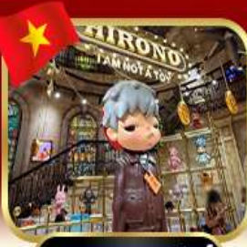
popmart บานาฮิลล์