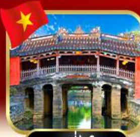
สะพานญี่ปุ่นโบราณ