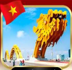
สะพานมังกร ดานัง