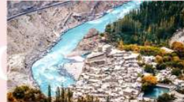
หมู่บ้าน Hopper Valley

*ที่พัก Gilgit : Kellisto Hotel หรือเทียบเท่า