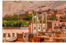
เมืองเกาค์ซการ์