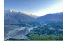
หุบเขาดุยเกอร์

*ที่พัก Duike : Hard Rock Resort หรือเทียบเท่า