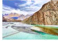
สะพานแขวนสุสไซน์

*ที่พัก Duike : Hard Rock Resort หรือเทียบเท่า