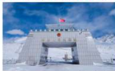
ด่านชายแดนหงฉีลาฝู

*ที่พัก Passu : Sarai Silk Route Hotel หรือเทียบเท่า