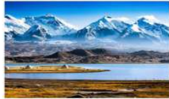
ทะเลสาบคาราคูล