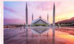
มัสยิดไฟซาล (Faisal Mosque)

*ที่พัก Islamabad : Hillview Islamabad หรือเทียบเท่า