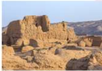
เมืองหินทาชเคอร์กัน