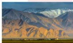
พระอาทิตย์ขึ้นที่ภูเขาเมฆหัด อะทา