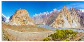
หุบเขาพาสส์ (Passu Valley)

*ที่พัก Passu : Sarai Silk Route Hotel หรือเทียบเท่า