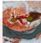
ภูเขาไฟโคลน