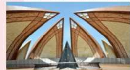
อนุสาวรีย์ปากีสถาน

*ที่พัก Islamabad : Hillview Islamabad หรือเทียบเท่า