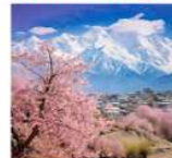
Rakaposhi Galcier View Point

*ที่พัก Hunza : Hunza Darbar Hotel หรือเทียบเท่า