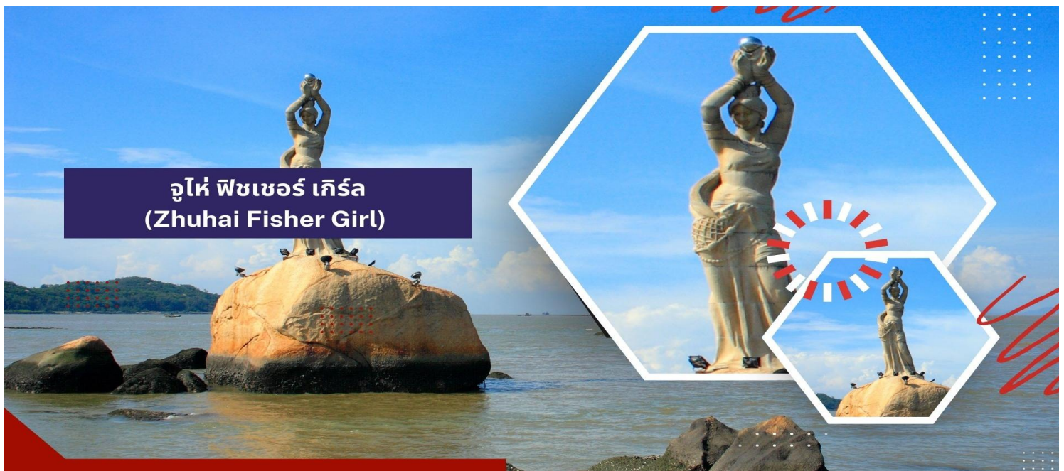
จูไห่ ฟิชเชอร์ เกิร์ล (Zhuhai Fisher Girl)

** ชำระค่าทัวร์ในนาม บริษัท นิดน้อย ทราเวล จำกัดเท่านั้น **