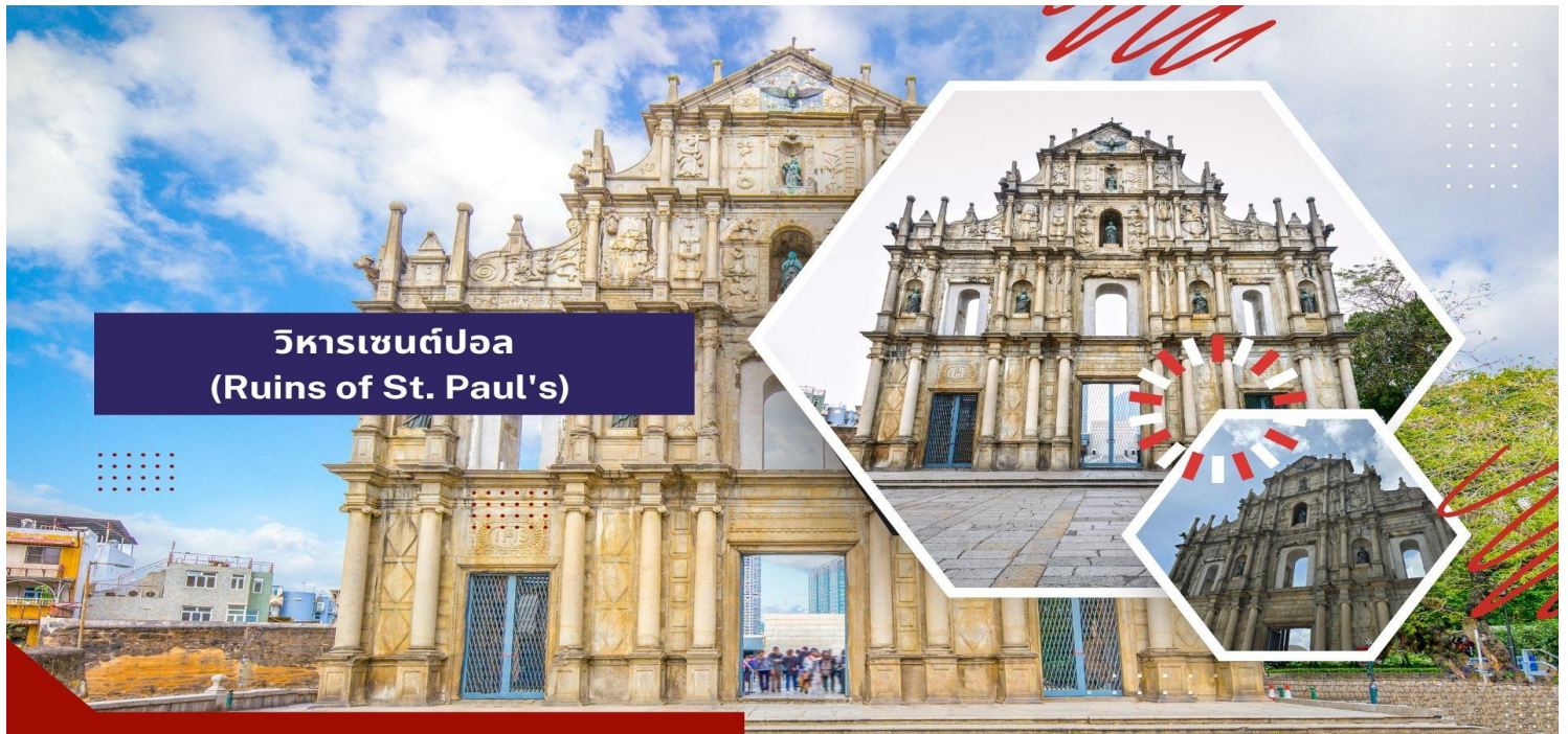
วิหารเซนต์ปอล (Ruins of St. Paul's)

** ชำระค่าทัวร์ในนาม บริษัท นิดน้อย ทราเวล จำกัดเท่านั้น **