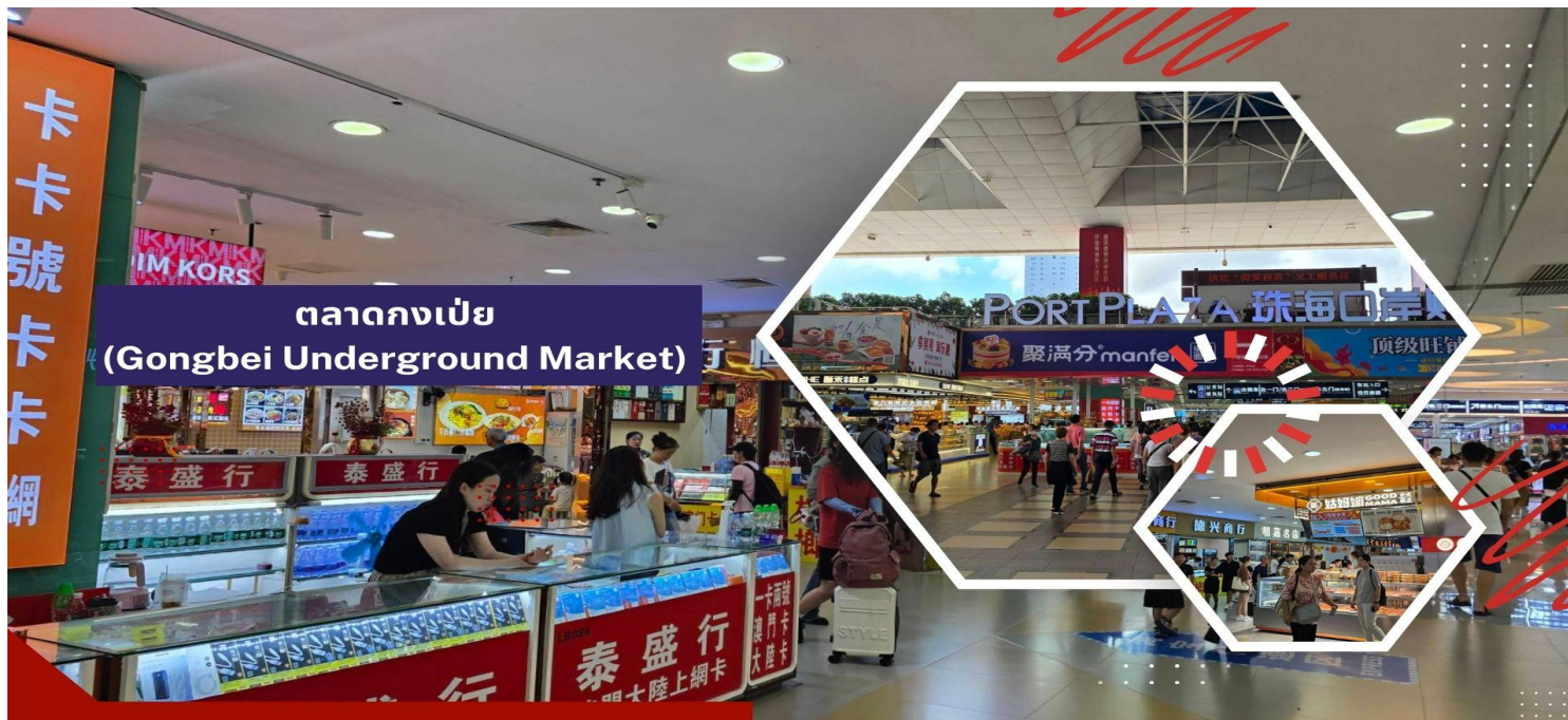
ตลาดกงเป๋ย (Gongbei Underground Market)

** ชำระค่าทัวร์ในนาม บริษัท นิดน้อย ทราเวล จำกัดเท่านั้น **