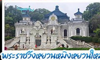
พระราชวังเซวานเหมิงเซวานหนีเหมิง