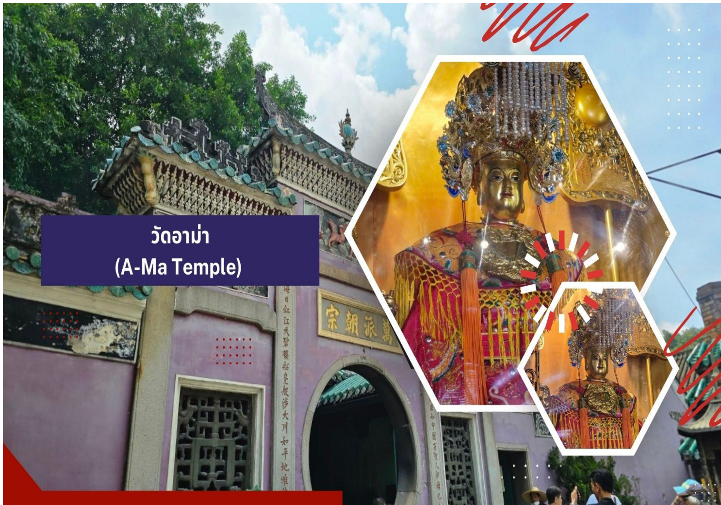
วัดอาม่า (A-Ma Temple)

โดยมีชาวจีนกวางตุ้งและฟูเจี้ยนเป็นชนชาติดั้งเดิม จนมาถึงช่วงต้นศตวรรษที่ 16 ชาวโปรตุเกสได้เดินเรือเข้ามายังคาบสมุทรแถบนี้เพื่อติดต่อกำขายกับชาวจีน และมาสร้างอานานิคมอยู่ในแถบนี้ ที่สำคัญ คือ ชาวโปรตุเกสได้นำพาเอาความเจริญรุ่งเรืองทางด้านสถาปัตยกรรม และศิลปวัฒนธรรมของชาติตะวันตกเข้ามาอย่างมากมาย ทำให้มาเก๊า กลายเป็นเมืองที่มีการผสมผสานระหว่างวัฒนธรรมตะวันออกและตะวันตกอย่างลงตัว