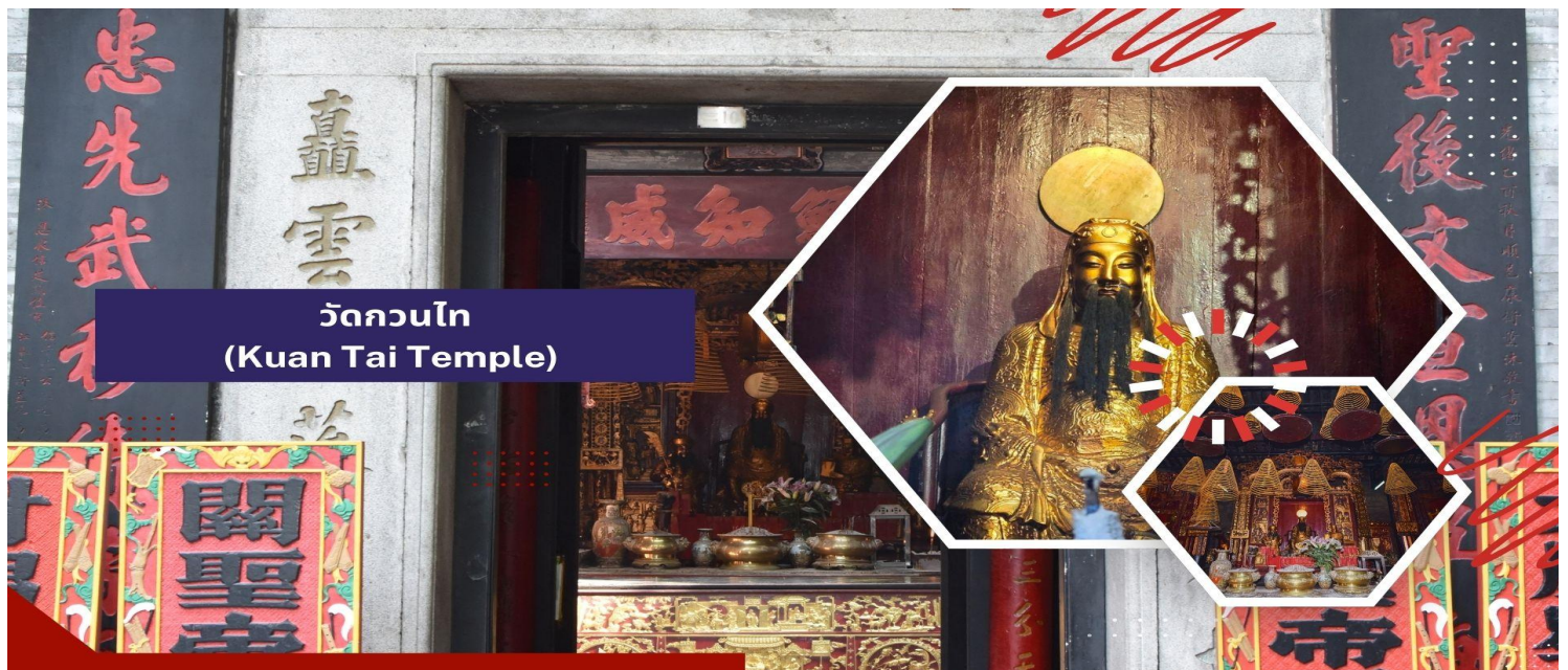
วัดกวนไท (Kuan Tai Temple)

นำท่านชม วิหารเซนต์ปอล (Ruins of St. Paul's) โบสถ์แห่งนี้เคยเป็นส่วนหนึ่งของวิทยาลัยเซนต์ปอล ซึ่งก่อตั้งในปี ค.ศ. 1594 และปิดไปในปี ค.ศ. 1762 และเป็นมหาวิทยาลัยตามแบบตะวันตกแห่งแรกของเอเชียตะวันออก โบสถ์เซนต์ปอลสร้างขึ้นในปี ค.ศ. 1580 แต่ถูกทำลายถึงสองครั้ง ในปี ค.ศ.1595 และ ค.ศ.1601 ตามลำดับ จนกระทั่งเกิดเพลิงไหม้ในปี ค.ศ. 1835 ทั้งวิทยาลัย และโบสถ์ถูกทำลายจนเหลือแต่ด้านหน้าของตึกฐานโบสถ์ส่วนใหญ่และบันไดด้านหน้าของตึกแสดงให้เห็นถึงสไตล์ผสมระหว่างตะวันออกและตะวันตกและมีอยู่ที่นี่เพียงแห่งเดียวเท่านั้นในโลก