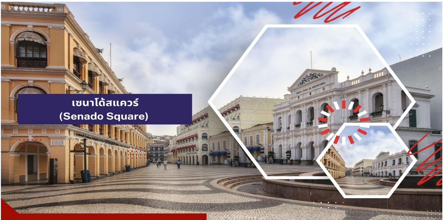
เซนาโดสแควร์ (Senado Square)

** ชำระค่าทัวร์ในนาม บริษัท นิดน้อย ทราเวล จำกัดเท่านั้น **