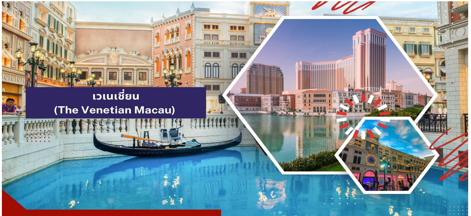
เวเนเซียน (The Venetian Macau)

จากนั้นนำท่านถ่ายภาพกับ ปารีสเซียน (The Parisian Macau) ซึ่งเป็นรีสอร์ทหรูหรารอบวงจรที่ตั้งอยู่ในมาเก๊า ได้รับการออกแบบมาเพื่อจำลองหอไอเฟล แห่งปารีส อัสระให้ท่านได้เพลิดเพลินกับการถ่ายรูป