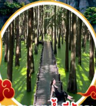
ป่าสนกลางน้ำสีมัทละ