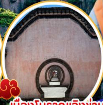
เมืองโบราณเจิ้งข่าน