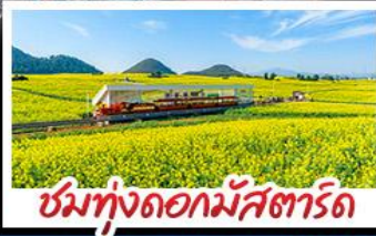
ชมทุ่งดอกไม้สตาร์ด