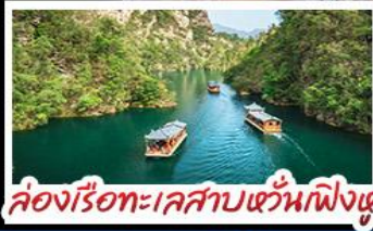
ล่องเรือทะเลสาบหวนเฟิงหู