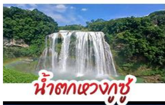
น้ำตกหวงกู่

สะพานหุบเขาชาวจีนง สะพานแขวนที่ยาวที่สุดในโลก ปราสาทจิ้งหลิงเป่า - หมู่บ้านแม้วอูเจียงจ่าย กุ้ยหยางชมทุ่งดอกไม้สตาร์ดและดอกซากุระ ล่องเรือทะเลสาบหวนเฟิงหู - น้ำตกหวงกู่ พักโรงแรมระดับ 4 ดาว - ชมหอเจียวฮิวไหล เมนูปลาดำซูเปอร์ริว - ไม่ลงร้านช้อปปิ้ง